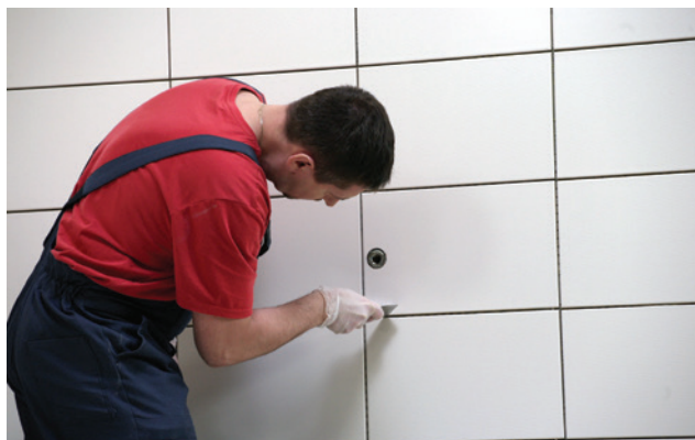
Vyčistenie škár a okrajov obkladov od zvyškov lepidla.