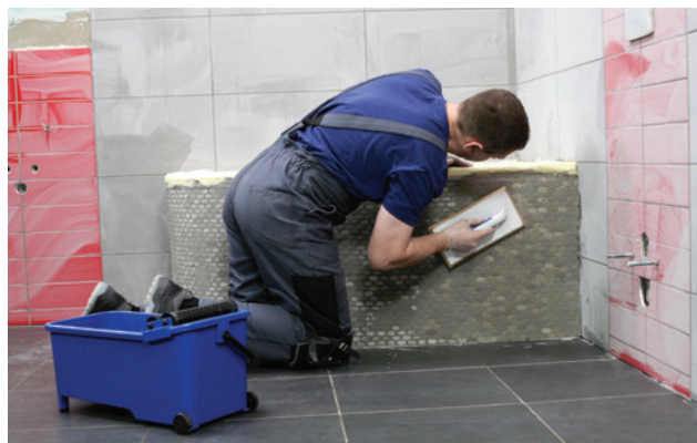
Škárovacia hmota CE 40 je vhodná aj na škárovanie mozaiky.