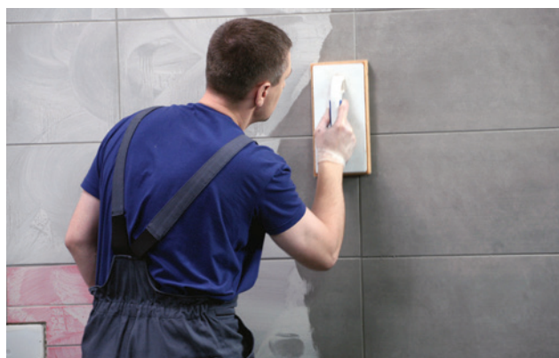
Doba schnutia sa pohybuje v rozmedzí od 5 do 30 minút.