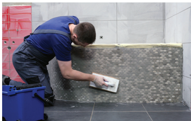
Škárovanie mozaiky by malo byť vykonávané krúživými pohybmi.